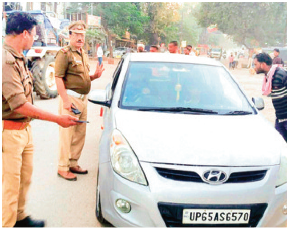
न करें। ब्लैक फिल्म लगाकर वाहन न चलायें। वाहन के साथ स्टंटवाजी करके न चलायें। अपने वाहन में हूटर/मोडिफाइड साइलेंसर/मानक के विपरीत तीव्र ध्वनि वाले हॉर्न का प्रयोग न करें।

अभियान के दौरान सड़क दुर्घटनाओं में कमी लाने के उद्देश्य से शहर के प्रमुख चौराहों पर बिना सीटबेल्ट, हेलमेट, दो पहिया वाहन पर तीन सवारी, मोडिफाइड साइलेंसर/प्रेशर हॉर्न के विरुद्ध चलाया गया सघन चैकिंग अभियान, जांच के दौरान 197 वाहनों का एम.वी.एक्ट की सुसंगत धाराओं में चालान किया गया। इसी क्रम में यातायात पुलिस द्वारा शहर भर में वाहन चालकों को यातायात नियमों के प्रति जागरुक किया गया। विभिन्न चौराहों पर चलाये गये सघन चैकिंग अभियान के दौरान यातायात पुलिस द्वारा बताया गया कि वाहन चालक यातायात नियमों का पालन आवश्यक रूप से करें और सुरक्षित रहें। यातायात प्रभारी ने कहा कि दो पहिया वाहन चालक हेलमेट अवश्य लगायें, जिससे की किसी दुर्घटना के घटित होने पर वह सुरक्षित रह सके। दो पहिया वाहन पर तीन सवारियों न बैठाकर न चलायें। शराब इत्यादि का नशा करके वाहन न चलायें। चार पहिया वाहन चालकों से सीटबेल्ट का प्रयोग करके वाहन चलाने की भी अपील की। सवारी व लोडिंग टेक्सी चालकों से नियंत्रित गति और सुगम रूप से यातायात व्यवस्था संचालन के लिए कहा गया। बिना नंबर प्लेट के वाहन न चलायें। वाहन को ओवर स्पीड से न चलायें। सड़क पर सदैव अपनी बायीं दिशा में चलें। वाहन चलते समय मोबाइल फोन/ईयर फोन आदि का प्रयोग